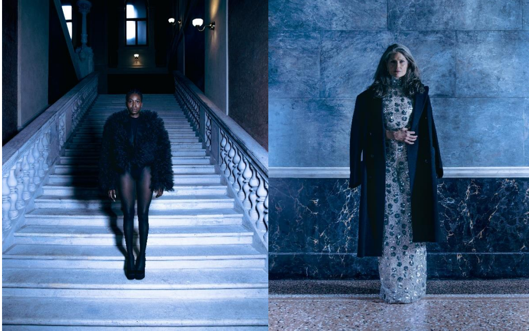
TÜLL & PAILLETTEN

Die Upcycling-Kollektion zeigt deutlich, welches künstlerische Potenzial in Second Hand Kleidung steckt und setzt somit einen inspirierenden Maßstab für künftige Entwicklungen im Bereich nachhaltiger Mode.